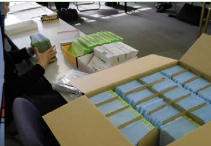
<10月実習>書類挟み込み (15,000 部)