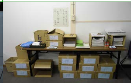
<10月実習>作業棚スペース