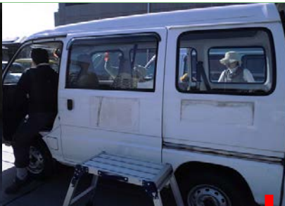
<10月実習> 公用車洗車