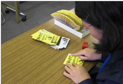
<9月実習>ポケットティッシュ挟み込み ①ちらし折りの様子 (15,000 部)

毎月末に、小金井市役所にて庁内実習を開催しています。事務補助作業から、公用車洗車、草むしりを行う月もあります。毎月5名程の方にご参加頂いています。施設に所属はせずここで就活をされている方、就労移行や就労継続 A 型・B 型に通所中の方など、様々な方が就労準備として参加されています。参加者は事前に職員と面談を行い、「スピードを意識する」「社会人としてのマナーに気を配る」「体調管理をして全日程参加する」など一人一人目標を設定して臨みます。その目標に対し達成できたかどうかを職員と日々振り返りを行うことで、自分の今の状況を客観的に把握します。また、自分の得意・不得意を見つけ、どの方面で就職活動を行うのかの参考にもしています。今後も庁内実習が参加者の皆様にとって良い訓練と気づきの場となるよう努力して参ります。