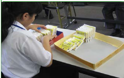
<9月実習>ポケットティッシュ挟み込み ②挟み込みの様子 (15,000 部)