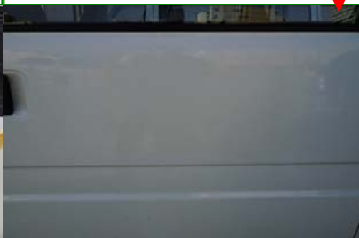
<10月実習>洗車終了後