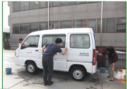
<9月実習> ・公用車洗車