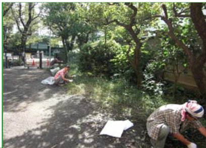
<9月実習>・草むしり（本町児童館）