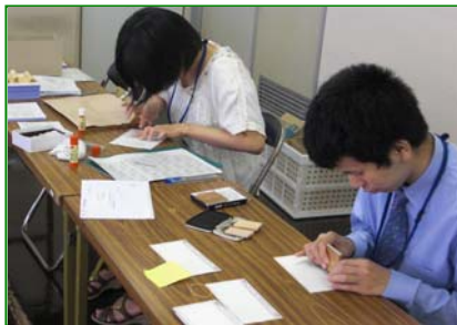
<8月実習> ・スタンプ押し ・ミスプリ直し