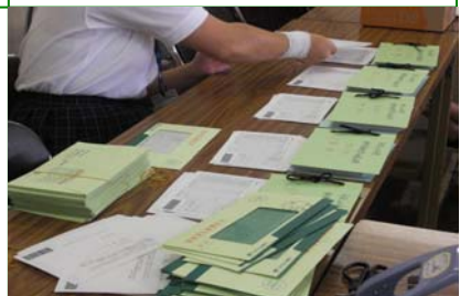
<9月実習>・会計課 書類綴り