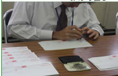
<8月実習> ・スタンプ押し